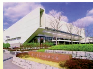
熊本県立総合体育館