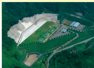
熊本県総合射撃場