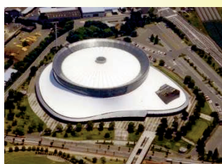
パークドーム熊本