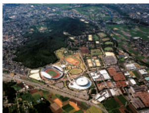
熊本県民総合運動公園